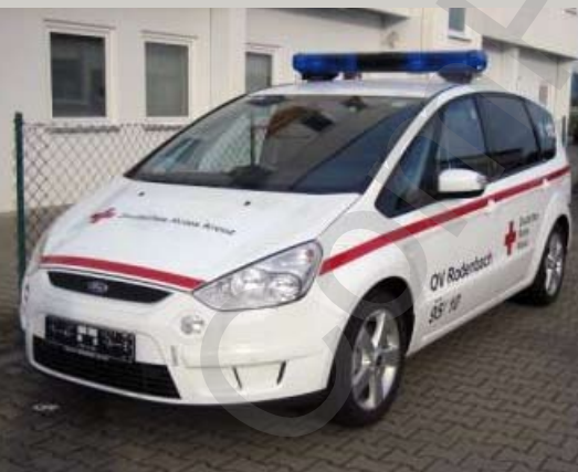
Ford S-Max NEF/KdoW