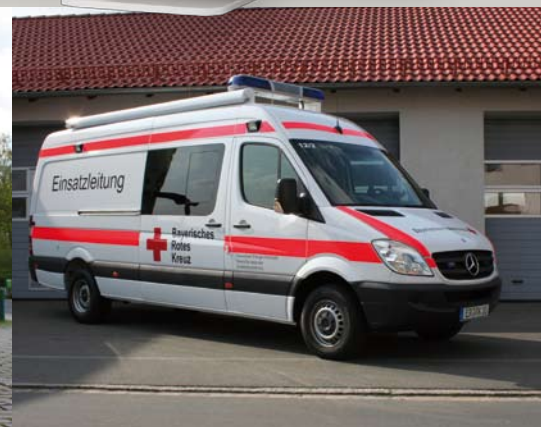
Mercedes Sprinter BRK