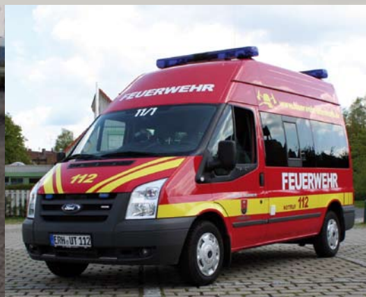
Ford Transit MTW/MZF