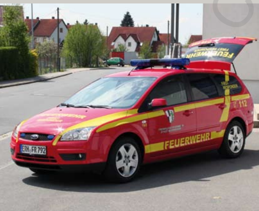
Ford Focus KdoW